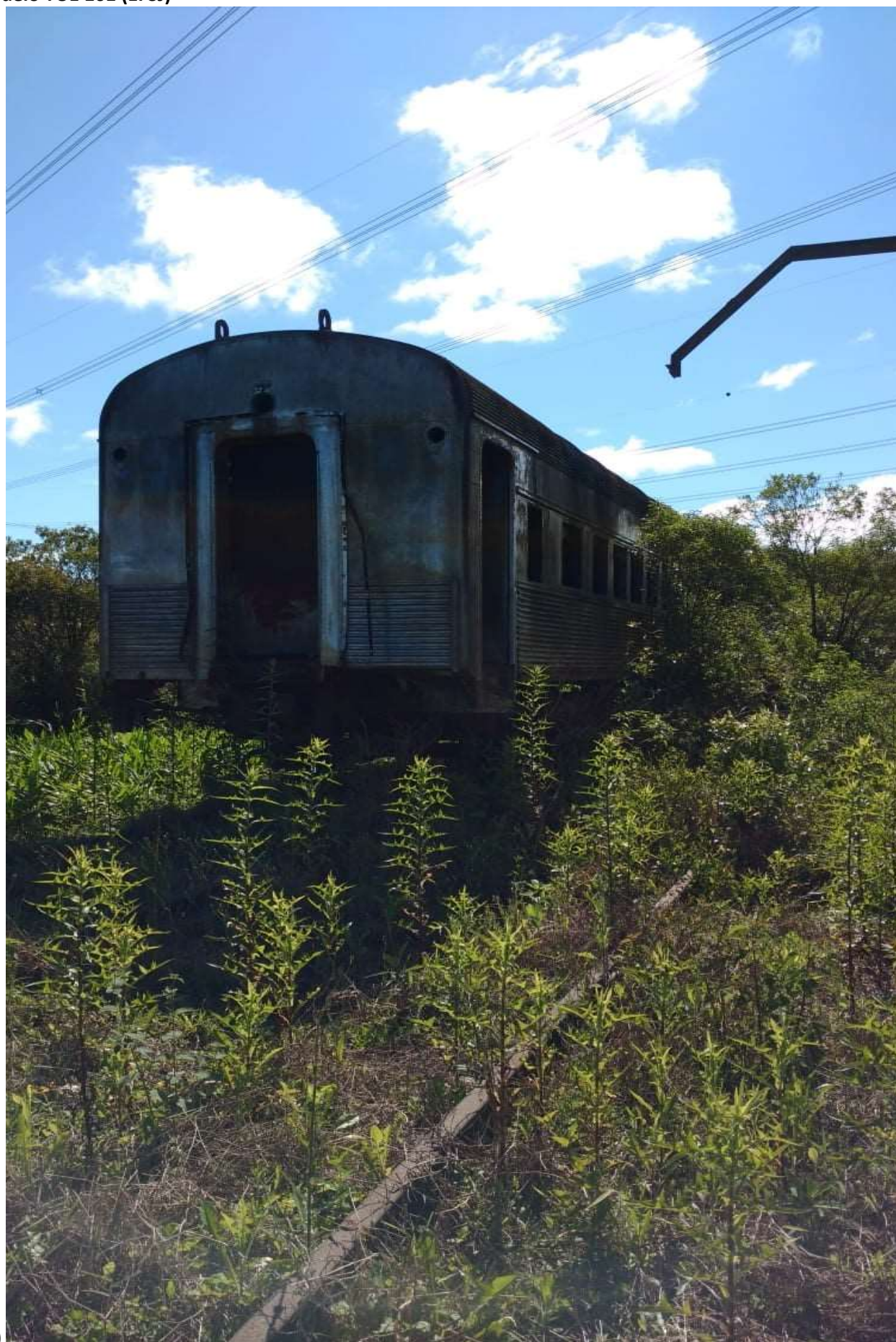
2ª Opção. Vagão de Aço (AUTOR DAS FOTOS: MARCEL MARTINS) Modelo TUE 101 (EFSJ)